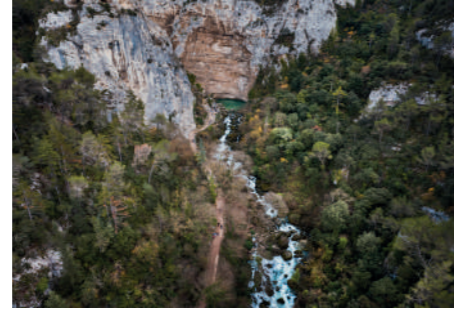
Vue aérienne du gouffre